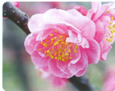
梅 一 輪

「卒業」「鳥帰る」「霞」「春疾風」「蜩」「春燈」と、当季雑詠です。ご投稿お待ちしております。