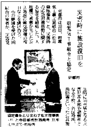
京都新聞 掲載 平成24年1月19日 市民版