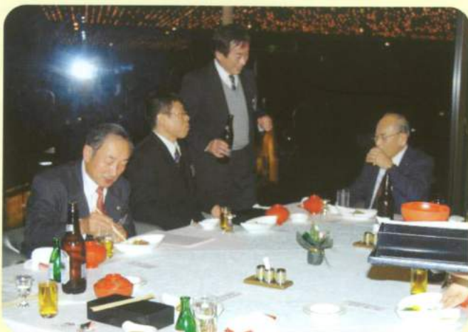
美味しいお酒とお料理で話も弾みます

ご来賓の皆様お世話になりました。支部員の皆さん、今年も支部事業に計画、参画をお願いします。