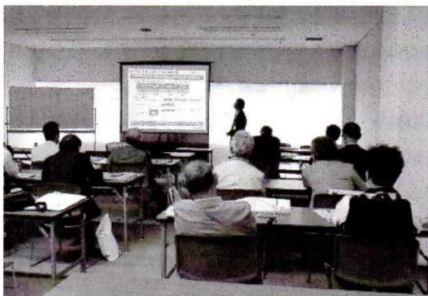
研 修 会 様 子

6月5日(木)は大阪南港のATCホールに於いて、 パナソニック株式会社ソリューションズ社主催の住宅/非 住宅の新商品の内覧会『NEW BOX 2014』が開 催されました。伏見支部より13名、山科地区より4名、 関西電力㈱とパナソニック㈱より5名、以上合計22 名の参加がありました。ATCホールにて昼食を取り、 その会場内に於いて午後1時より2時迄、節電と省エ