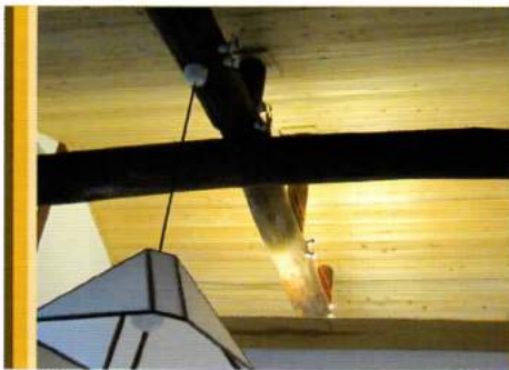
◀内部一部現状土壁