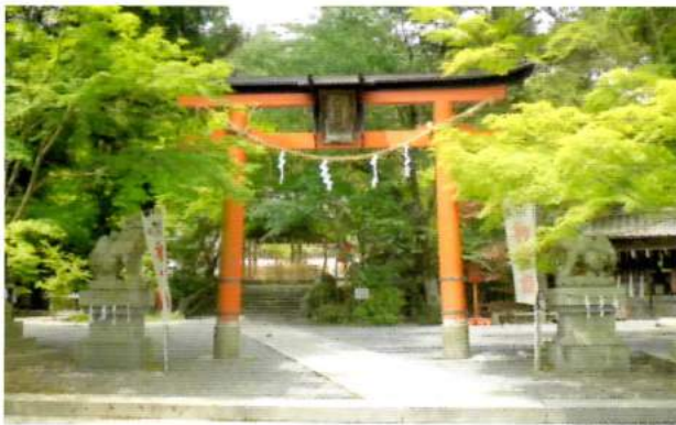
新緑の頃も又、色あでやかです