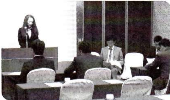
青年部の活動報告がなされ、審議されました

第2号議案では、25年度の収支決算について承認がなされました。当青年部事業を充実させ、外部事業への積極的参加において、親会様からの助成金、会員からお預かりした会費を適正に、そして有用に活用させて頂きました。