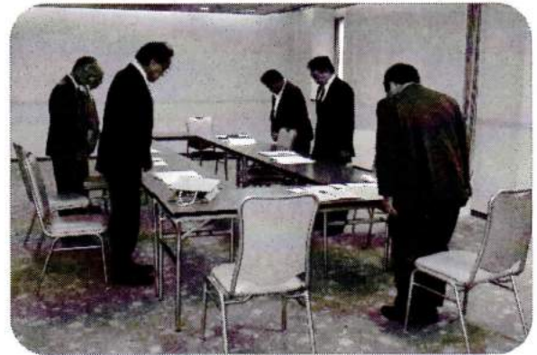
亡き友を偲んで黙祷を捧げる

最後にご逝去されました皆様のご冥福と、残られた関係者の方々の益々のご活躍を祈念いたしまして筆をおきます。