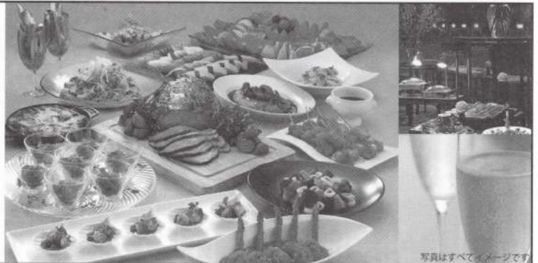
写真はすべてイメージです