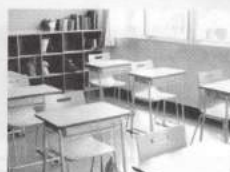
学校や教育施設など