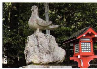
鳥居に鎮座している「狛鳩」