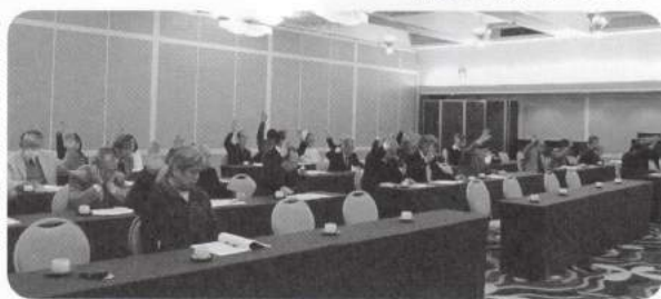
予算支部会審議の様子