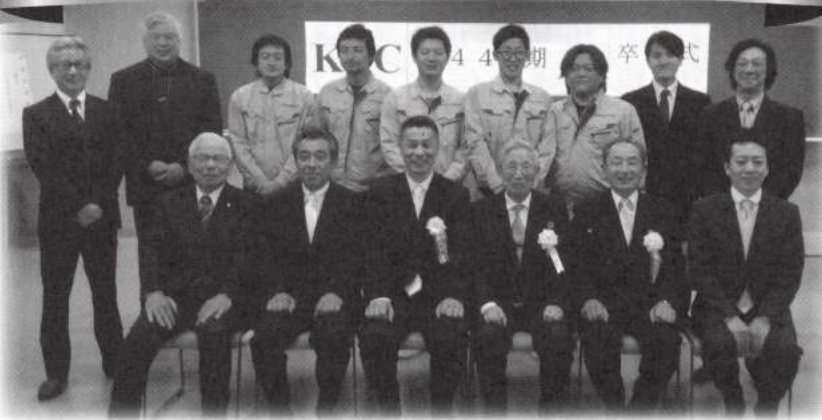
卒業生・役職員一同