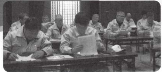
実務実地研修の様子

宮津研修後の机上研修時のアンケートにおきましても、殆どの調査員が忙しい中指導して頂いたことに対する感謝の言葉が多く見受けられました。本当に有難うございました。