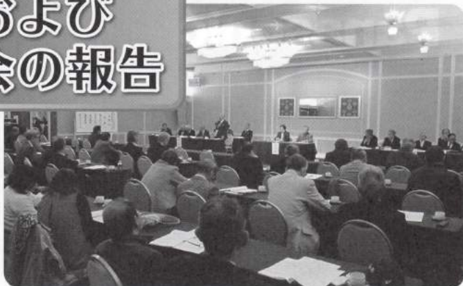
予算支部会の模様

去る3月24日(火)新・都ホテルに於いて平成27年度職別国保電気支部予算支部会、および電気支部互助会予算総会が総代52名出席のもとに盛大に開催されました。