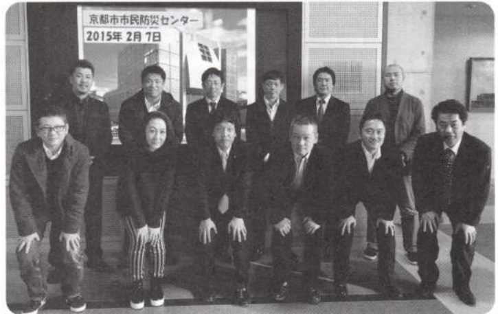
京都市市民防災センターにて新年研修会開催