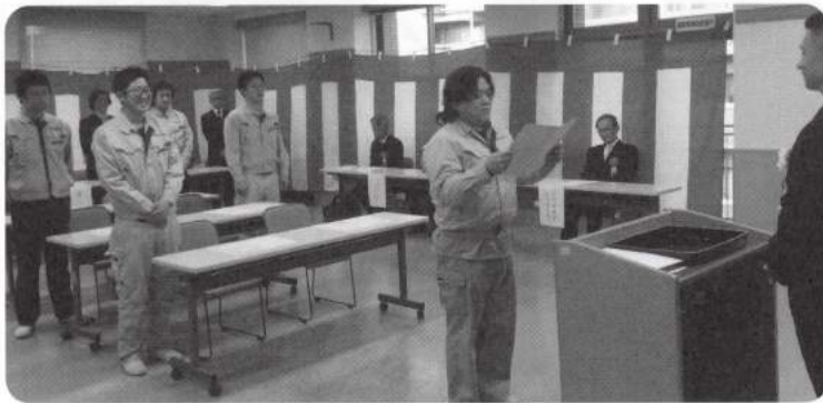
卒業生代表 磯野君による答辞