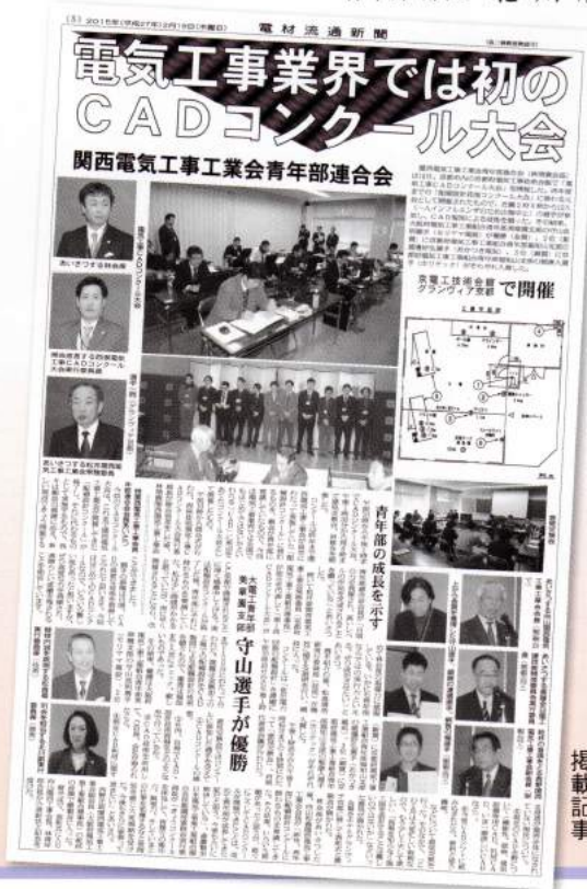
電材流通新聞 「電気工事CADコンクール大会」 掲載記事