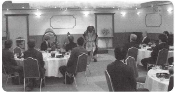
新年賀詞交歓会の様子