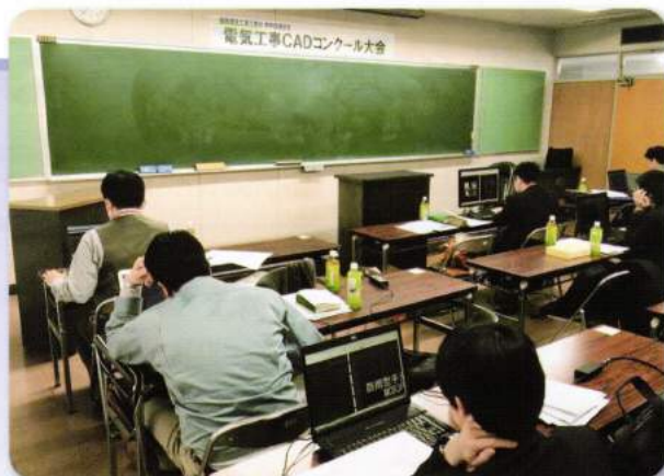
電気工事CADコンクール大会の様子

去る2月14日(土)、京都府電気工事技術会館に於いて『電気工事CADコンクール大会』が開催されました。