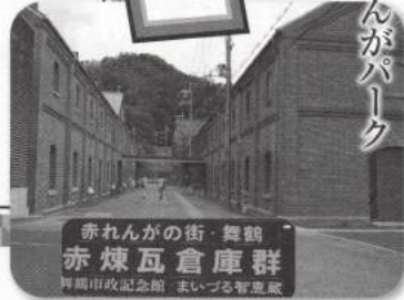
赤れんがの街・舞鶴 赤煉瓦倉庫群 舞鶴市政記念館 主いづる官産蔵

れんが一枚一枚がしっかりと繋がり 今も変わらぬ姿を魅せ人の歩む道を 教えています。(赤れんがサポーター)