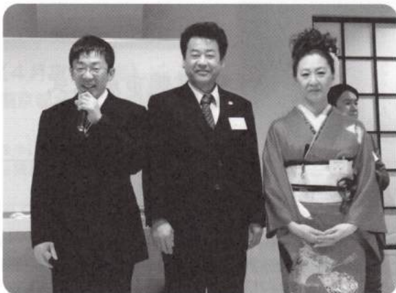
京都青年中央会 新春懇談会にて（平成27年1月17日）

その結果、嬉しい事がありました。現在青年部会員の大多数を占める福知山、宮津、舞鶴、小浜の4支部の若手が支部を越えて協力し合おうと自主的に集まってくれるようになった事です。電気屋から電気的事だけで繋がるんやのうて、いざという時の仲間の絆を育てていってくれたらええと思っております。