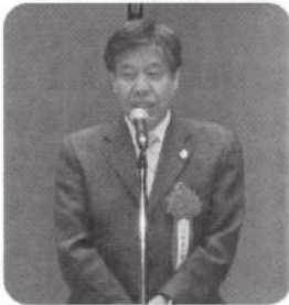
京都府山下副知事より ご祝辞を賜わる

新年を祝して、当日の参加は、来賓 22名、賛助会員 14名、組合関係 79名の計 115名で、