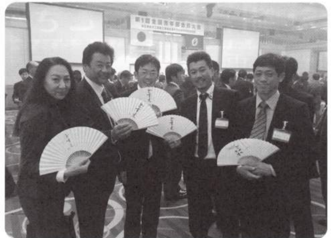
全国青年部会員大会にて（平成26年11月28日）

また、全日電工連青年部協議会、関西電気工事工業会青年部連合会、京都青年中央会の親睦事業にも積極的に参加して貰えるようになった事も嬉しいニュースの一つです。