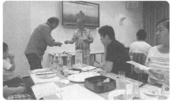
表彰式・反省会の様子

参加人数は17名と少なかったのですが、参加者は全員が精鋭の方々でハイレベルな熱戦でした。松井名誉理事長も写真にもありますようにスペアをゲットし、その実力を発揮されておりました。