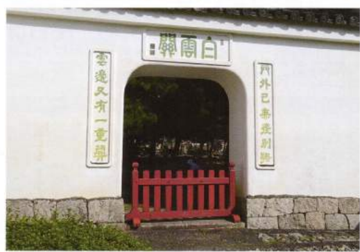
三門左側の窟門「白雲關」