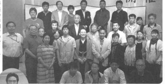
研修会参加者の皆さん