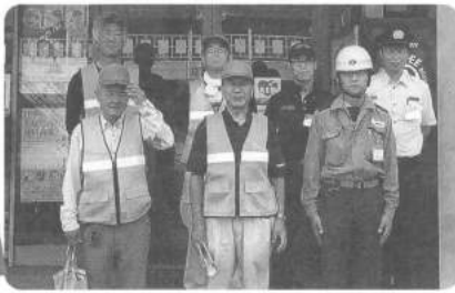
午前 に実施したメンバー