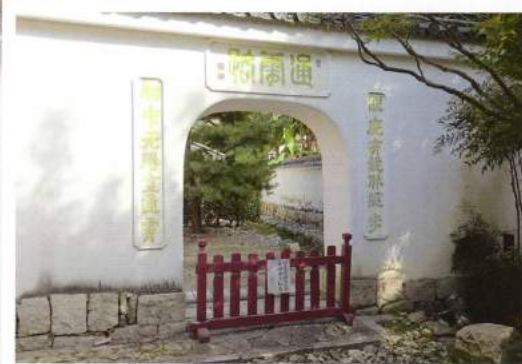
三門右側の窟門「通霄路」

萬福寺の玄関である総門をくぐり放生池を過ぎると、ひときわ大きな三門が見えてきます。その三門の脇、右と左に竜宮の門のような漆喰で固められた、一般の参拝客はめったに目に留めない小さなくぐり門があります。この門を「窟門」と呼びます。黄檗山の独特の建築様式の中でも中国情緒豊かな雰囲気醸すこの二つの窟門は明和五年（1768年）に建築されました。