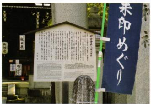
応仁の乱 勃発の地