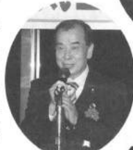
尾関市議より 祝辞