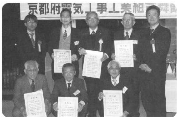
支部長賞・地区長賞に選ばれた皆さん

内研からの小工事優良事業所への表彰では、支部長賞・地区長賞に選ばれた皆さんへ関西電力(株)舞鶴技術サービスセンター瀧本所長より、賞状と賞品が授与され内研活動へのお礼の言葉をいただきました。