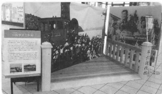
ユネスコ世界記憶遺産登録を記念して、東舞鶴駅ロビーに設置された平引揚棧橋です。