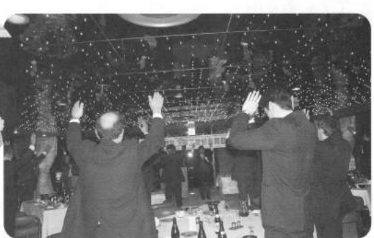
ご来賓・出席者皆さんで万歳三唱!

今日この日のために、ご多忙にも関わらずご臨席いただきましたご来賓の皆様には、過分なご祝儀、また華を添えていただき誠にありがとうございました。この宴の為に早くから計画・準備、そして当日とお世話いただいた役員の皆様お疲れ様でした。