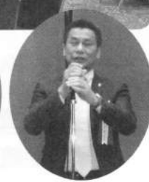
鎌谷副理事長の閉会の挨拶