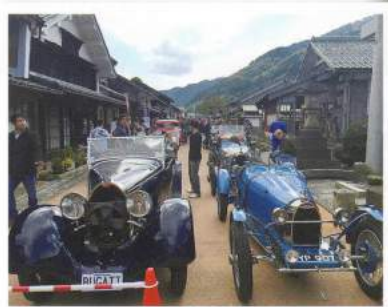
インターナショナル・ブガッティ・ミーティング・ジャパンで古い町並み熊川宿へ、古い名車ブガッティが来訪。