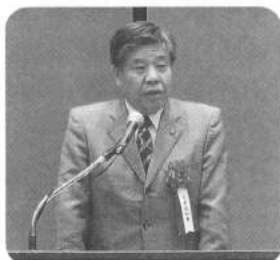
京都府山下副知事よりご祝辞を賜わる