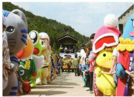
熊川いっぶく時代村 『ゆるキャラと山車をひこう』

子どもたちのお囃子を乗せて山車が巡行します。 近隣各地のゆるキャラたちが登場！ ゆるキャラが子ども達と仲良く歩きます。