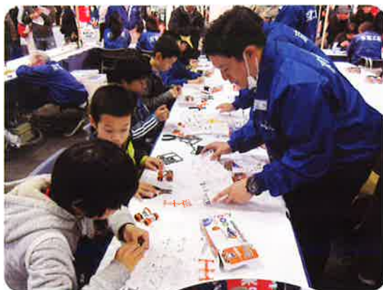
◀ソーラー工作体験は子ども達に大人気。毎回すぐに席が埋まり大好評!