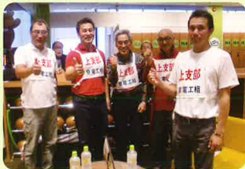
強いぞ！ お見事三連覇!! 上支部