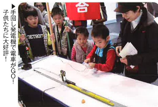
▶手回し発電機で電車がGO! 子供たちに大好評!