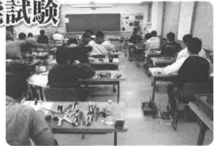
第一種技能講習の様子

講習会では公表問題全10問を本試験同様に技能 訓練してもらい、効率よく短時間で作業するノウハウ を講義し、受講者の方も、非常に熱心に課題に取り組 まれていました。