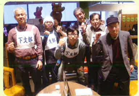
かみなぎる復活の2位!! 下支部