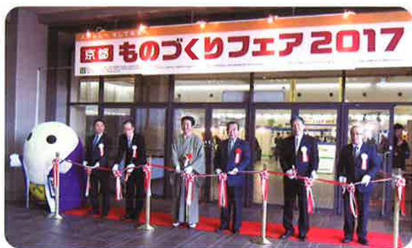
▲テープカットで今年も「ものづくりフェア」が開幕!