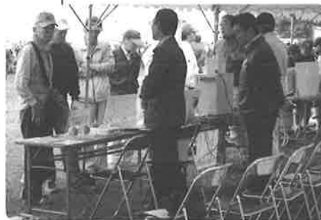
舞鶴支部も展示コーナーをお借りして参加