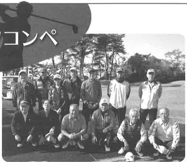
ご参加のみなさま