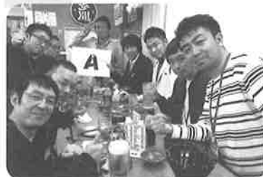
お酒を囲んで、いい笑顔ですね!

最後に第3部の懇親会が開催され、第2部での写真の投票、並びに表彰式も開催され、お互いの写真を称えあったり、仕事の話や社員教育の話まで大盛り上がるの会員大会となりました。