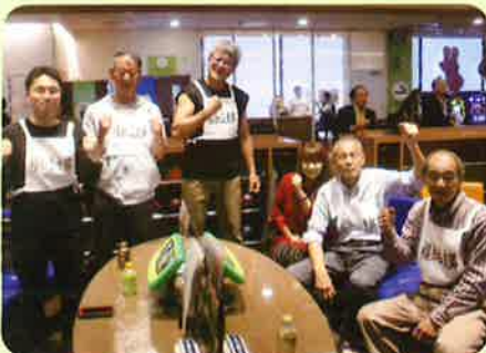
ファイトー発!! 5位の福知山支部