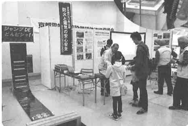
京都電気消防設備団体連絡協議会ブース

会場内ではステージイベントも盛りだくさんで、最 後にお楽しみ抽選会もあり、多くの入場者で賑わいま した。