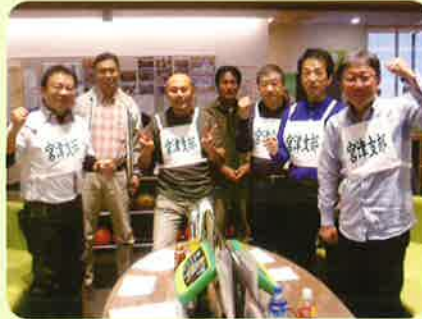
次回はトロフィー頂くぞ!! 4位の宮津支部