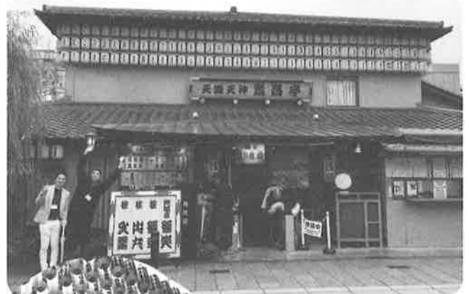
▲繁昌亭小さいながらも趣があります。

その後、各グループに分かれて大阪を撮影しながら移動し、「大阪やなあ」と思うものを撮影する第2部の「大阪をキリ撮る!」も開催され、串カツを囲むものあり、何故か銭湯へ赴くものありで、バラエティに富んだ内容でした。お互いあまり知らない中でも目標に向かえば一致団結でき、遊びの中にも学びが、学びの中にも遊びがある。そんなことを学ばせていただいた会でした。