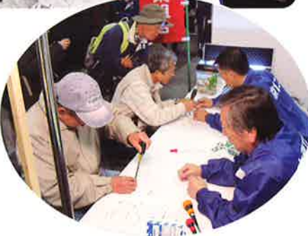
▶マンツーマンで延長コードを手作り。