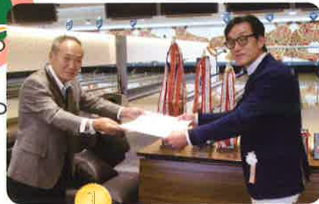
1 優勝 上支部

11月3日（金）MKボウル上賀茂において 第14回支部対抗親睦ボウリング大会が80数名の 参加を得て盛大かつ華やかに開催されました。