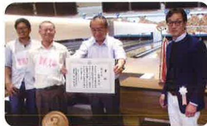
3 第3位 舞鶴支部

大会は、7支部と役員・事務局の8チームによる団体戦 および個人戦とし、1チーム5名で、1人3ゲームを投球し、 女性には1ゲーム10ピンのハンデを与え、前大会の男女 を問わず1位は3ゲームトータル60ピン（-20ピン×3 ゲーム）2位は-45ピン（-15ピン×3ゲーム）、3位は- 30ピン（-10ピン×3ゲーム）のハンデとし、マイボール使 用の方は3ゲームトータル45ピン（-15ピン×3ゲー ム）のハンデとしてアメリカン方式により競技されました。