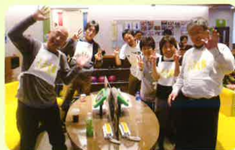
やっぱりチヨキの 勝ちです！ 小浜支部