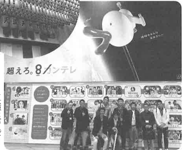
▶大阪と言えど「かんでくれ」?

最後に第3部の懇親会が開催され、第2部での写真の投票、並びに表彰式も開催され、お互いの写真を称えあったり、仕事の話や社員教育の話まで大盛り上がるの会員大会となりました。