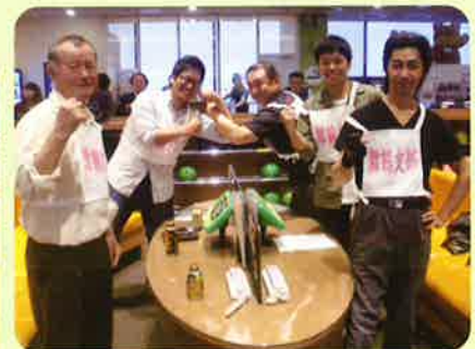
美しい男の絆で堂々の3位!! 舞鶴支部