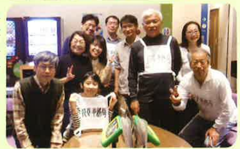
定位置へ逆戻りしたく なかつた… 役員・事務局