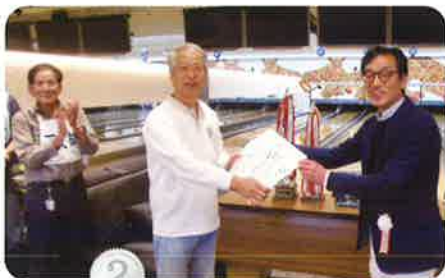
2 準優勝 下支部