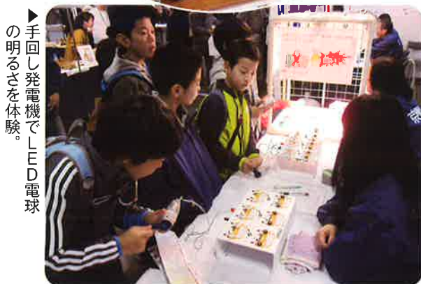
▶手回し発電機でLED電球の明るさを体験。