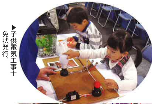
▶子供電気工事士免状発行。