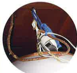
このようなヶ所もあり

一方、福知山地区においても、福知山市高齢者福祉課ならびに民生児童委員皆さんのご要望(診断希望されるご高齢者皆さんの)を踏まえ、5地域約80軒を約1週間に亘って横断的に診断する計画が実行され、同日福知山市役所前に集合、高齢者福祉課小田課長様からご挨拶を頂き市内惇明校区内からスタート、市内3日間56軒・下夜久野1日20軒・最終日翌週大江町1日1軒の診断を行いました。この間動員数は、総勢70名(行政民生21・消防13・関電6・工組30)での診断となりました。診断結果は、接地不良・ELB未設