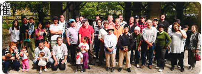
参加いただいた皆さん

10月1日(日)に宇治市笠取にあるアクトパル宇治野外センターで支部主催のバーベキューパーティーを開催しました。バスをチャーターし40名以上の参加で大いに盛り上がりました。