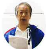
辰本大会運営副委員長 競技内容説明