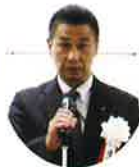
鎌谷大会運営委員長 講評

鎌谷大会運営委員長の講評のとおりに、時間的にタイトで完成させるのが困難な課題でありましたが、施工図・施工条件・注意事項を守りお客さまの施設に配慮されていたことや、電気の危険性を十分わきまえて安全に作業されていました。