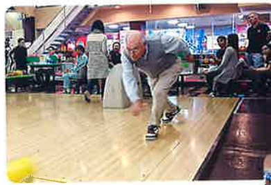
ボウリング大会の様子