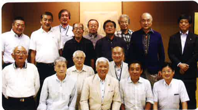
平成29年7月開催 編集全体会議にて