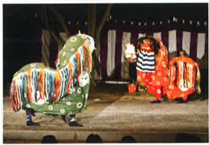
祇園祭花笠巡行奉納