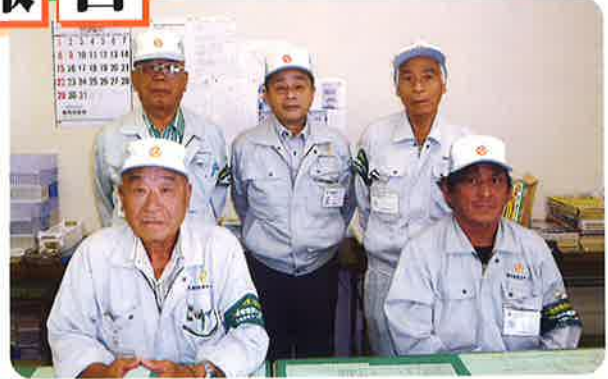
宮津調査センター 調査員

近年は訪問調査に警戒を持たれる家庭もあります。当調査センターではまず明るい笑顔で訪問する事に努め、トークスクリプトの活用と接遇態度に充分留意する事により調査がスムーズに進むよう、調査員は日々努力を重ねております。去年の11月には老夫婦のお客様より、「調査員の礼儀正しさと点検内容が親切丁寧で非常に印象が良かった。」と、わざわざ礼状が届いたことがありました。担当の調査員はもとより、努力すればお客様も必ず認めていただけるの