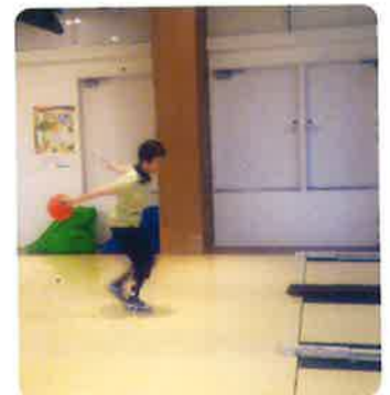
ボウリング大会の様子

去る9月30日(土)、木津地区恒例のボウリング大会を京田辺市ステーションボウル新田辺におきまして開催致しました。当日の参加者は9人と、少し寂しい大会となってしまいましたが、参加者皆さん自分の投げたボール