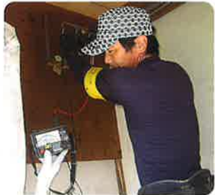
下夜久野町での訪問診断

置・絶縁不良などがありましたが、訪問先で「プロに、見てもらったのは初めて、これで安心です」と言われ喜んでいただいたものと感じました。