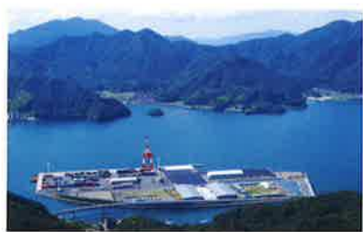
和田沖舞鶴国際埠頭 (みずなぎ埠頭)