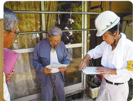
綾部地区での訪問診断

当日ご協力いただきました行政・消防・関西電力(株)の皆さま、さらには民生児童委員の皆さま、組合員の皆さま、暑い中大変ご苦勞さまでした。事故も無く無事終了できたことに感謝申し上げます。今後とも、ご高齢の皆さまが安心して生活できる環境づくりを目指しご協力賜りますようお願いし御礼のご挨拶といたします。ありがとうございました。