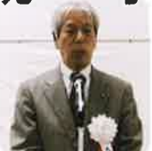
向山大会会長 開会挨拶