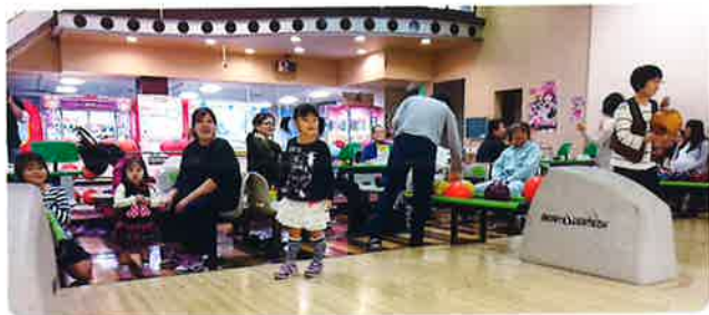
お子様から大先輩まで参加

なかなか思い通りにボールを投げられず、日頃の運動不足や腰が痛いなどと何かと上手に言い訳しながら皆か