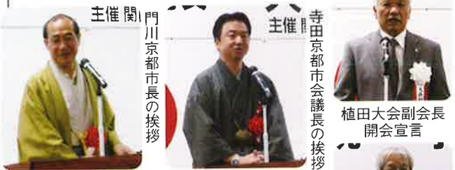
植田大会副会長 開会宣言