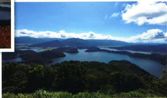
三方五湖(若狭町側)