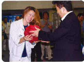
豪華賞品・景品を贈呈

厚生委員長気配りの豪華賞品・景品が、支部長の手から「おめでとう」の声つけて、拍手の中でありが