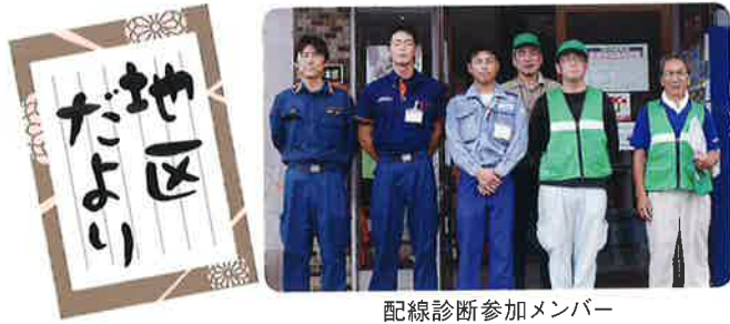
配線診断参加メンバー