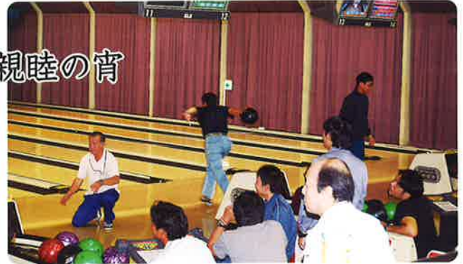
ボウリング大会の様子

とう! 成績上位5名が、来る11月3日(金)本部主催支部対抗ボウリング大会に舞鶴支部代表選手として、出場が決まりました。舞鶴支部上位入賞、応援よろしくをお願いします。