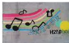
上賀茂小学校の絵