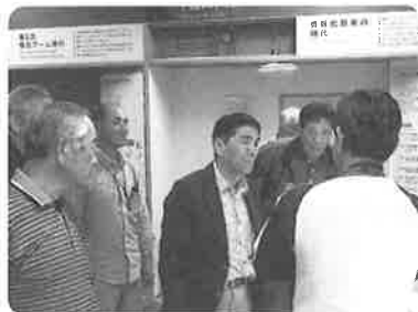
2班に分かれて見学