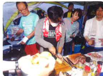
スタミナ源はプロの手で

ました。ところがあにはからんや! 24時に103位と踏み留まり、そこからの深夜・早朝、フル出場組が好走を重ね7時にはなんと99位を奪還。もうここからはまさかの夢に向かって全員必死。終了1時間前の11時には98位に上昇、ほぼ100位切りを手繰り寄せました。