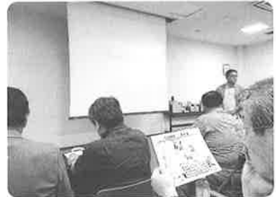
パナソニックライティングでの研修の様子

組合員さん27名、 パナソニック様2名、 関西電力様2名の合 計31名の参加にて 無事終了いたしました。 パナソニック様、 関西電力様ありが うございました。ご 参加いただきました 組合員の皆様、お 疲れ様でした。