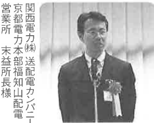
関西電力(株)送配電力カンパニー 京都電力本部福知山配電営業所 末益所長様