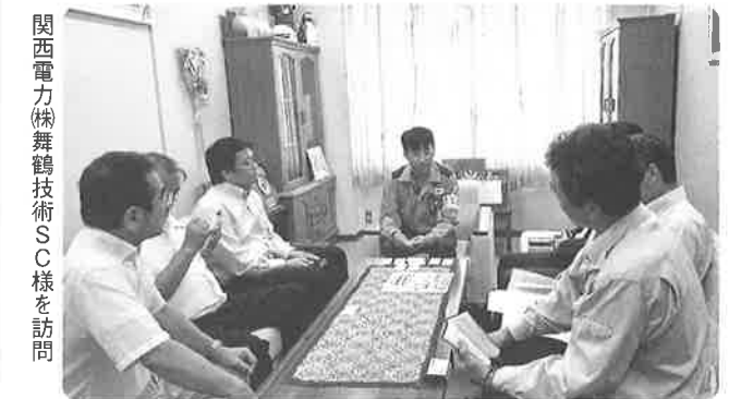
関西電力(株)舞鶴技術SC様を訪問