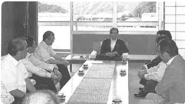
多々見舞鶴市長との会議

この日に併せ、多々見舞鶴市長との席をご用意いただき親しく会談できたことは、舞鶴支部として今回の行事への力強い励みとなり、行政との深い関わりの中での工組舞鶴支部としての明るい躍進となります。その為にも、今回のひとり暮らし高齢者宅無料電気配線診断の盛会が大きく期待されます。高齢者支援課より取り纏めいただいた希望者の方々に、