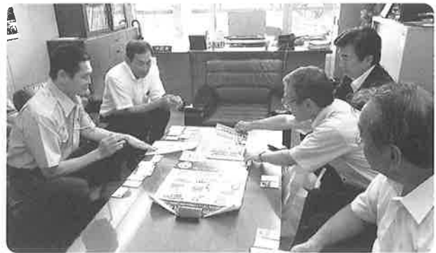
舞鶴市消防本部を訪問

舞鶴市消防本部・高齢者支援課・関西電力(株)舞鶴技術SC様に、実施日の案内とご協力をお願いしましたところ、快く受理していただき実施への一歩前進となりました。舞鶴市高齢者支援課様には計画当初より、高齢者配線診断希望者への要請から取り纏めまでお世話になり、今日を迎えられたお礼のご挨拶となりました。