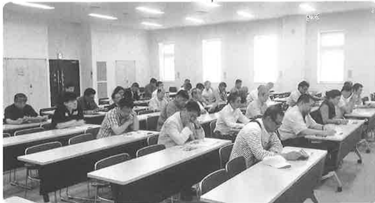
JESCO大阪での 研修の様子▶