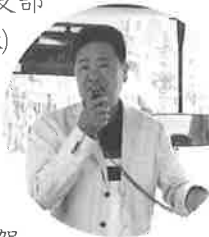
小山地区長の挨拶 と本日の予定

午前にはパナソニック様 のご厚意で三重県にあり ます、パナソニックライ ティングシステムズ(株)伊賀 工場に寄せていただきまし