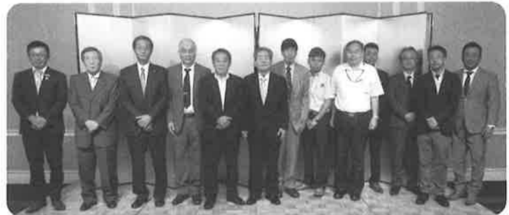
井上前支部長・新三役・新役員の方々

なお従来は、議案を抜粋し工報の紙面に掲載していたのですが、支部員(事業主)の皆様には、事前に議案書を送付いたしておりますので、議案の掲載は省略させていただきます。 (職別国保電気支部)