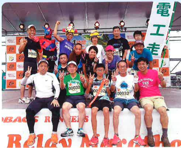
快走達成のメンバー

今年は戦力が増え、戦前大きく目標突破を期待はしており、130位切りが13時頃には見えてきました。15時には119位、18時には108位、そして21時には夢の99位を計時。21時過ぎには有力走者3名が翌日所用の為早退、快進撃もこれまで…。徐々に順位を下げていくことを想定・覚悟し