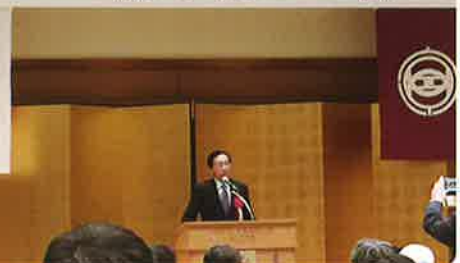
西脇京都府知事 のご挨拶

今年は任期満了に伴う人事年でもありますので、新たな青年部にご期待いただけるよう取り組んで