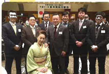
青年部参加者にて記念撮影

今年は任期満了に伴う人事年でもありますので、新たな青年部にご期待いただけるよう取り組んで