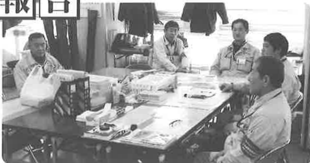
京都調査センター 定期調査3班スタッフ

があります。調査宅は大工さんで留守でした。家が隙間なく建っているので火事になれば大変です。この業務は一般の方々が電気知識が十分とは限らない為、送配電を行う電力会社が定期的に漏電など電氣的の不具合がないかを確認する業務です。「関西電力様から委託を受けての業務ですからしっかり見るように！」と新入社員の方には声を掛けています。