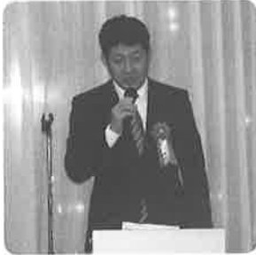
関西電力(株)舞鶴技術サービスセンター 野瀬所長よりご祝辞