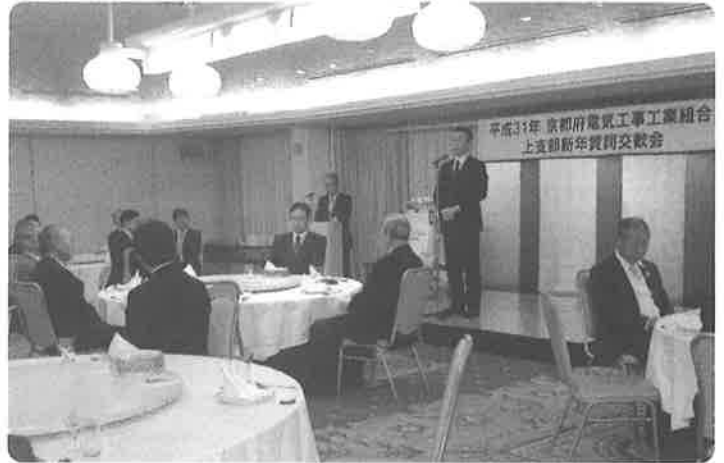
鎌谷副理事長のご挨拶