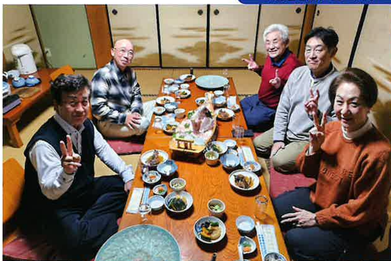
～ご馳走を前にピース!～