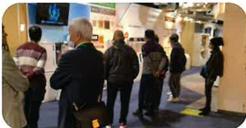
▲ ショールーム見学中