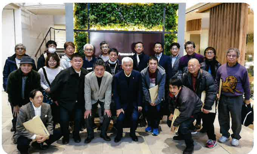
▲ エコシステムズさん 玄関にて記念撮影