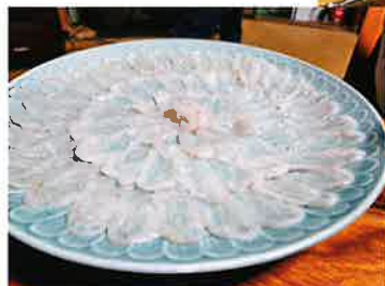
～すくい食いできる!～