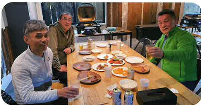
▲ マルシェ食事テーブル

令和5年12月17日(日曜日) 下京区麩屋町通綾小路下がる 「京都マルシェ BBQ」にて 午前12時集合 4年ぶりとなる バーベキュー大会を開催しました。 「新型コロナ」が蔓延する前は例年 京北町の運動公園にて「ソフトボール大会」の反省会を兼ねて開催されておりましたので 4年ぶり