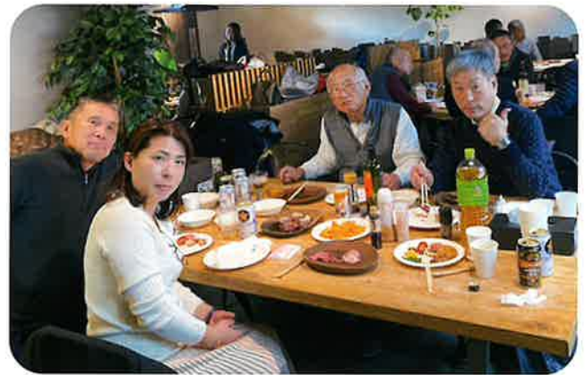
▲ マルシェ食事テーブル