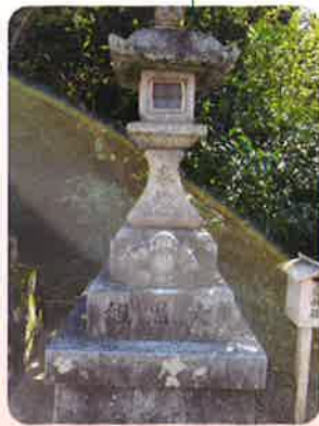
天神さんで有名な大黒様