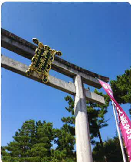
青空に天神さんの鳥居がキレイ