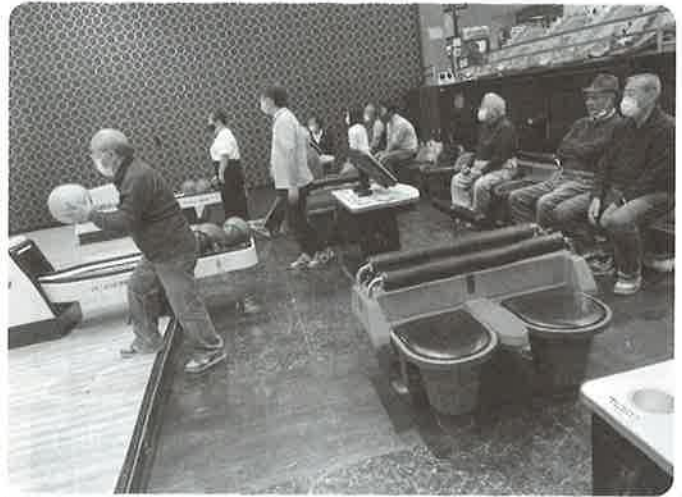
ボウリング大会の様子

ストライク、スピアを取るとグータッチで大いに盛り上がる中、足を滑らせてレーンの中へ倒れ寝る人、「なんで真ん中へ行かへんのやろ」とつぶやく