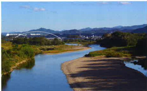
自然豊かな由良川

天正7（1579）年に丹波を平定した明智光秀は、この地に城と城下町を築きました。築城当時から残る個性豊かな石垣と、北近畿唯一の天守が福知山城の魅力です。