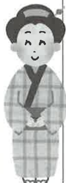
町人に人気の金さん