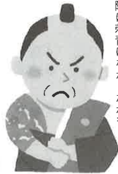
実際は刺青はなかったかも？