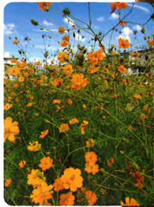
◀今年はオレンジ色のコスモスがトレンドなのかな

何度も行っている場所でも、違う道を通ったり、少し先まで足を運んだり。結構見てないんですよ、何回行っても。あと、京都を出て関西の気になる場所の散策に行こうと思っています。 地元イチジクシロップたっぷりのアールグレイかき氷▶