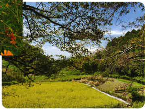
山野辺の道の田園風景

11月に入れば、滋賀で全国大会も開催され、懐かしい「仲間達」に会えるかと思うと本当に嬉しいです。延び延びになっていた研修会も今度こそできそうです。12月には静岡県工組で発足した女性部会の式典にもお伺いする予定です。