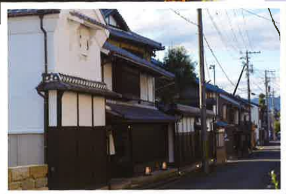
古民家ホテル「菱屋」と 城下町らしい風情のある町並み