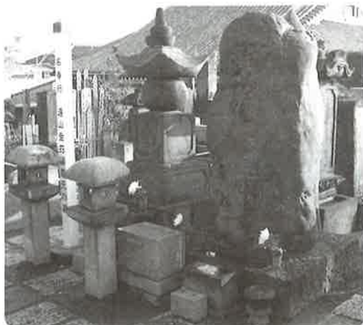
巣鴨にある金さんのお墓