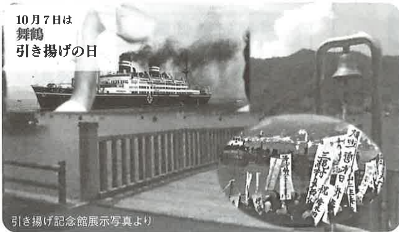
10月7日は 舞鶴 引き揚げの日