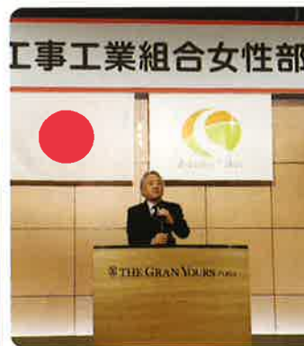
全日電工連 米沢会長のご挨拶