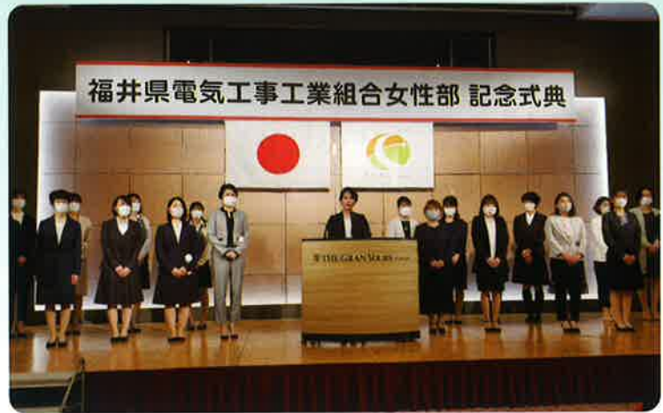
福井県工組女性部のメンバー