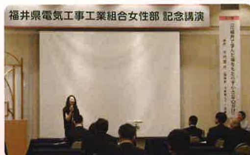
僭越ながら ご挨拶させて頂きました