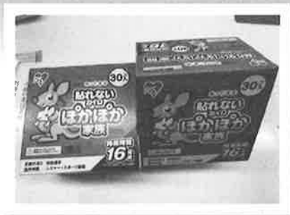
カイロの差し入れ