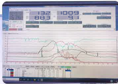
▲ハウス内環境の監視画面