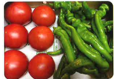
色鮮やかなトマトと万願寺甘とう

次にトマトと万願寺甘とうですが、土中水分センサーを土の中に入れ、定期的に土の水分を測り、乾燥していれば電磁弁を作動させ自動で水を供給し、潤えば電磁弁を閉めるという動作を行います。