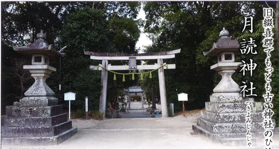
月読神社 境内入口