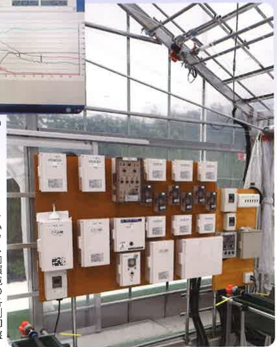
▶ハウス内環境の各制御盤

でも一粒100円程度しています。最近リゾートホテルのテニスコートを廃止し、そこにイチゴハウスを建てイチゴ狩りで集客を図るホテルもありました。