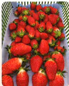
小粒から大粒の章姫▶