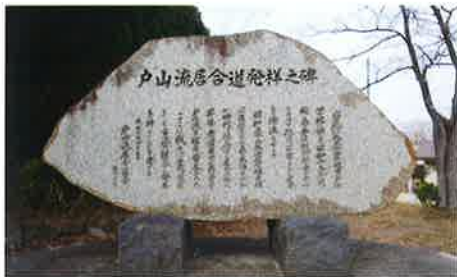
戸山流居合道発祥の碑