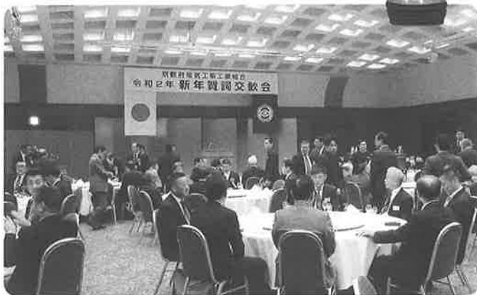
新年賀詞交歓会の様子

去る 1 月 14 日 (火) 令和 2 年 京都府電気工事工業組合の新年賀詞交歓会がホテルグランヴィア京都「竹取の間」にて、来賓、関係者あわせ 114 名が集集して午後 3 時から開催されました。