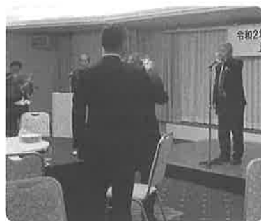
瀧葉顧問 乾杯の発声

本年度は地区統合を予定しており、統合予定の三地区の地区長も前向きな発言で、統合に向け前進する旨の話も話題になっておりました。時間の経過は早く定