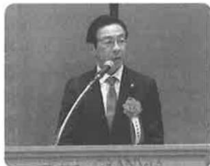
西脇京都府知事よりご祝辞

知事、京都市門川大作市長、京都府中小企業団体中央会会長(小山哲史 専務理事)、衆議院議員前原誠司様、