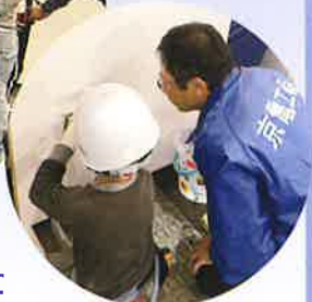
▲小さな電気屋さんで見守る青年部員