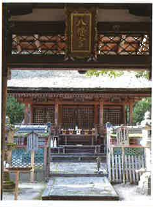
▲相楽神社 本殿(重要文化財)