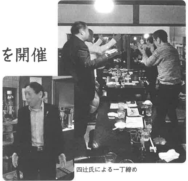
四辻氏による一丁締め

その後は場所が場所なので、皆様それぞれに行きつけのお店などに行かれたのではないのでしょうか。当日、ご参加いただいた皆様、役員の方々お疲れ様でした。