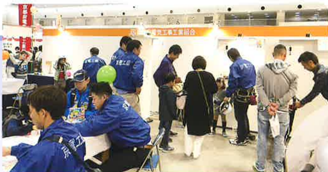
◀元気な子供達で賑わう会場