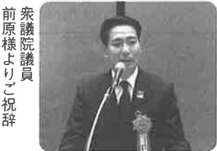
衆議院議員前原様よりご祝辞