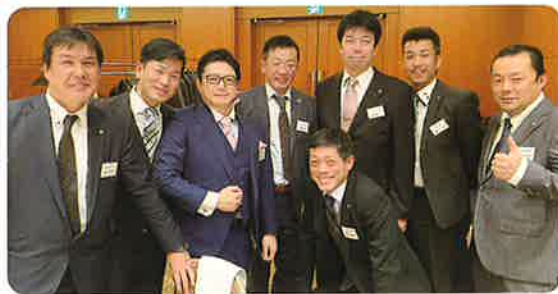
参加した青年部役員と元青年部役員たち

昨年は、田辺高校との交流事業・CAPフェスタでの職業体験・ものづくりフェアでの職業体験など、結果が出せた1年であり、西脇知事、門川市長のご挨拶で話が出たのは青年部として感無量です。今年は、昨年同様組合本部様と連携して時代に沿った新規事業