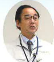
福多委員長の挨拶

教育指導委員会にて、 さる11月20日(水) 13時40分～15時30分の 2時間、府立工業高等学校 1年生31名を対象に 交流事業を実施しました!