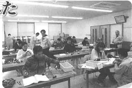
第二種受験対策講習会の様子

京都電気技術専門学院において「第二種電気工事士技能試験受験対策講習会(下期)」を11月23日(土)・24日(日)、翌週11月30日(土)・12月1日(日)には「第一種電気工事士技能試験受験対策講習会」を実施いたしました。