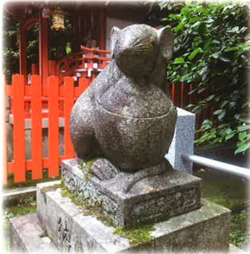
大豊神社 大国社の吽形狛鼠(左)と阿形狛鼠(右)