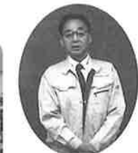
福多学院長の挨拶