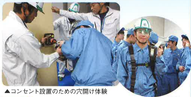
▲コンセント設置のための穴開け体験