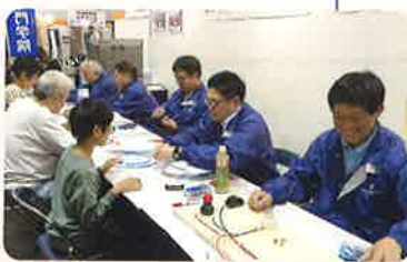
LANケーブル子供電気工事士コーナーの様子

出展内容は、延長コード・LANケーブル作成・子供電気工事士(照明回路を結線させ、電気の仕事を理解させ点灯テストをし、見事点灯すれば写真撮影し免状を発行する)。初日で予定免状がなくなるほどの盛況振り、我が青年部は、ECOライト、持込企画の通電テスターを子供たちに製作してもらいました。