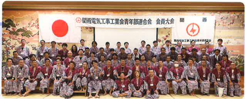
大会参加者で集合写真