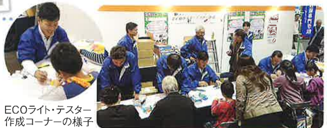
ECOライト・テスター作成コーナーの様子

通電テスターは、京都青年中央会で御世話になっている左官・塗装・管工事組合の方々に協力してもらい、電気を通すもの通さないものを置いてもらい実演してからスタンプを押して体験してもらおうラリー形式としました。景品が貰えるということで、子供の動線が絶えず最後まで我が工組は大盛り上がりでした。念願の奨励賞も受賞され喜びも一塩です。