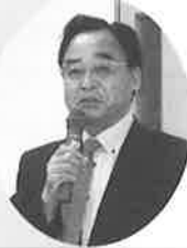
福多教育指導委員長の挨拶

この研修会は、AI・IoTに代表される第四次産業革命は電気工事業界にとっては新たな市場拡大となるビジネスチャンスでIoTの現状を把握し、需要を積極的に取り組む必要がある事などから開催されました。