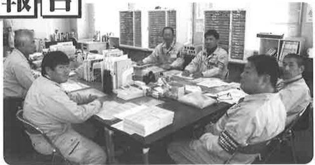
京都調査センター 定期調査1班スタッフ

されていたことは勿論ですが、丁寧な仕事、対応に大変喜んでおられ、最後に「安心したわ。」の一言をいただき、私も大変うれしく思いました。