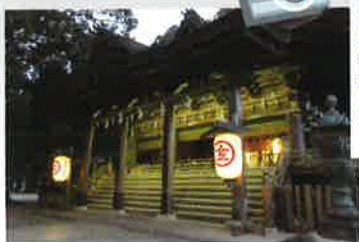
金刀比羅宮御本宮