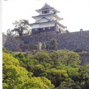
重要文化財 丸亀城