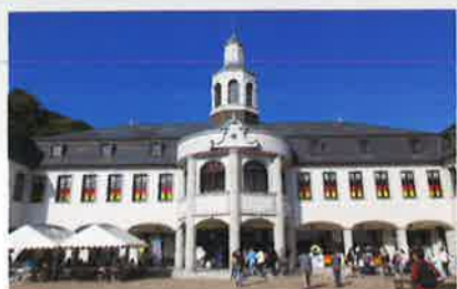
鳴門市ドイツ友好記念館 ドイツ館