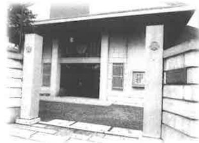
台風被害にあわれた 金光教 四条教会様