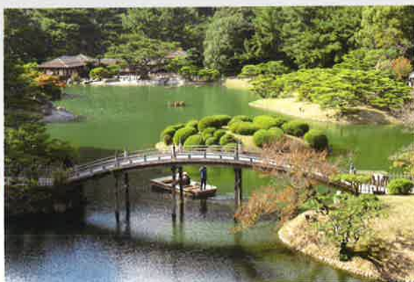
特別名勝 栗林公園

長時間のバス旅行となりましたが大変楽しい時間を過ごすことができ、参加者同士の親睦を深めることができました。