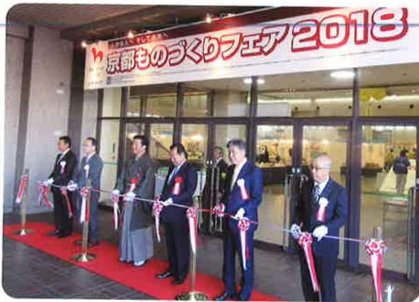
▲テープカットで今年も「ものづくりフェア」が開幕!

また、今年は参加62団体の中から6団体が受賞した奨励賞をいただきました。ご来場、ご協力いただいた関係各位に改めてお礼申し上げます。