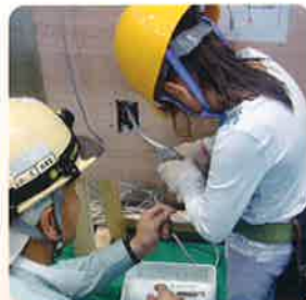
男の子も女の子も、みんな一生懸命です!!