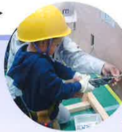
真剣な表情でスイッチやコンセントを取り付ける小さな電気屋さん!!