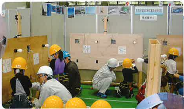
取り付けたスイッチで照明を点灯!▶