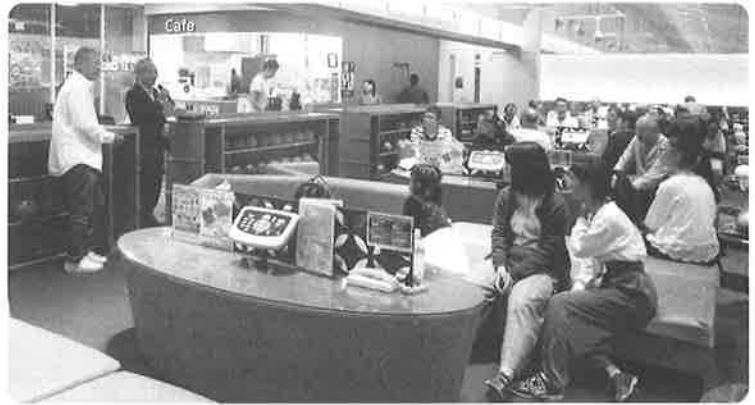
ゲーム開始前に門野支部長から挨拶