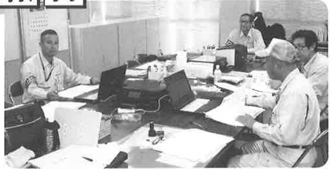
京都調査センター竣工調査班スタッフ

かりやすい言葉で簡潔にお伝えし、改修していただけるようお願いするかと感じております。最初の頃はなかなか上手く簡潔にお伝えすることができず苦勞しましたが、先日、絶縁不良の回路があったお客様のところでは、原因と対策のご説明をさせていただいたところ、深く信頼していただくことができ、お客様のご要望により「でんき工事ホームセンター」をご案内させていただけることができました。きっちり改修していただけたことで、この仕事の意義を感じることもできる良い機会ともなりました。