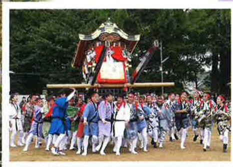
本番は神谷太刀宮を舞台に、「本太鼓」と呼ばれる飾太鼓台の演技奉納が行われます。