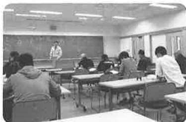
第二種受験対策講習会の様子

2日間の予定でしたが、30日午後から台風上陸に伴い、交通機関等予告運休が発表されていた為、30日のみ予定を変更し、午前9時