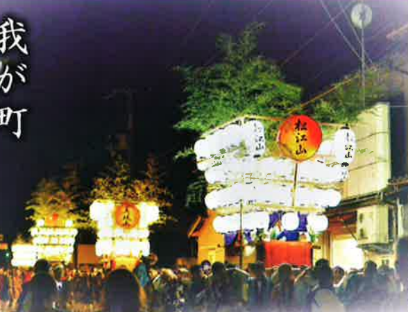
▲宵宮は提灯を飾り付けた「日和神楽」として町内を巡行する。