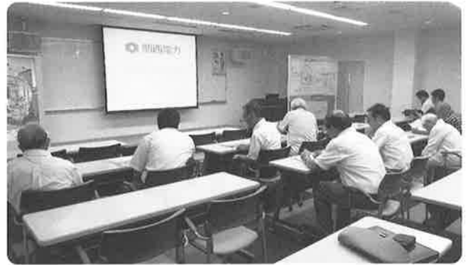
研修室にてまずは当センターの概要説明