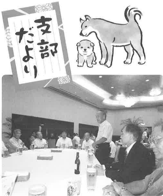
門野支部長の開会の発声