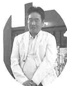
小山地区長の挨拶