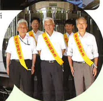
関西電力(株) 京都配電営業所前にて