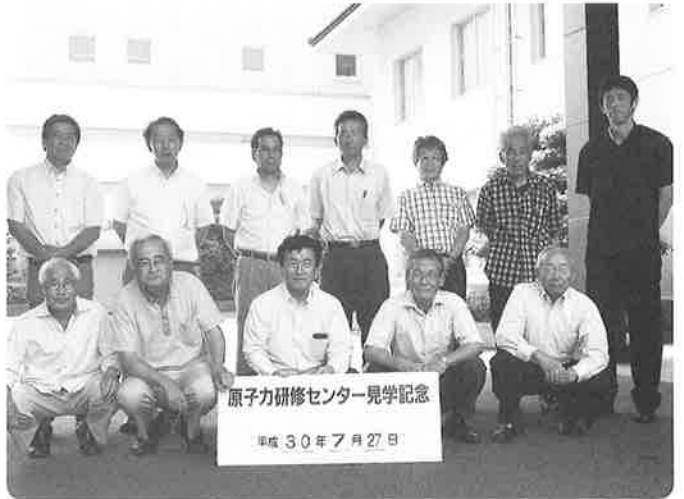
原子力研修センター見学会参加の皆さん