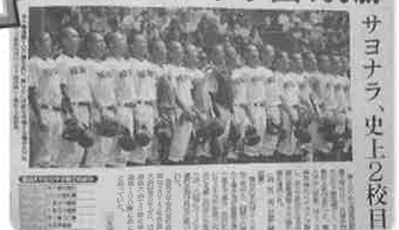
サヨナラ、史上2校目