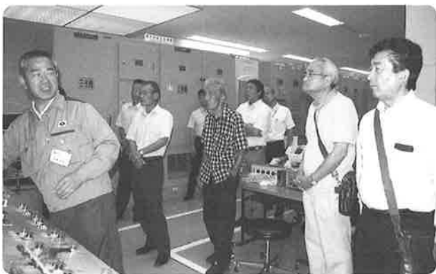
操作盤にて安全操作手順確認

自由化と分社化 便利か不便か迷うはお客様 現代社会に遅れ時と、 焦って変えて戻らぬ便利？