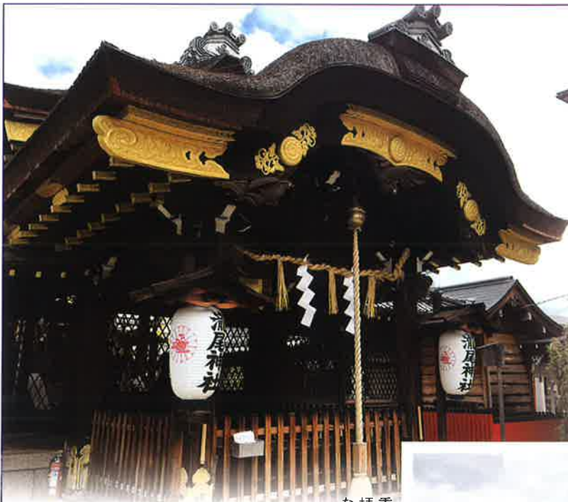
◀ 瀧尾神社 社殿