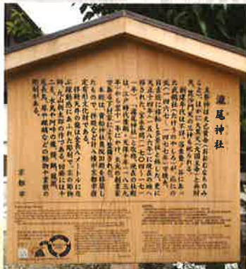
社殿横に立てられた駒札

重厚な拜殿(右)と社殿(左) 拜殿の天井には全長8メートルのなる龍の彫刻が施されています。