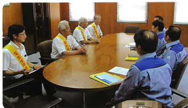
関西電力(株) 京都配電営業所にて意見交換