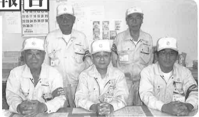
宮津調査センターメンバー

れます。理由は様々ですが訪問販売や、詐欺商法と勘違いをされたり、入室拒否、停電拒否、その他で調査ができない場合です。それでも調査員はプロ意識を持って次のお客様宅へ明るい笑顔で訪問するようにしております。そして何よりもこの調査業務が、地域の【安心・安全】な生活に一役担っている事を再認識しながら日々お客様とのコミュニケーションを大切にしてクレーム、トラブル等がないよう細心の注意を払い業務に邁進しております。