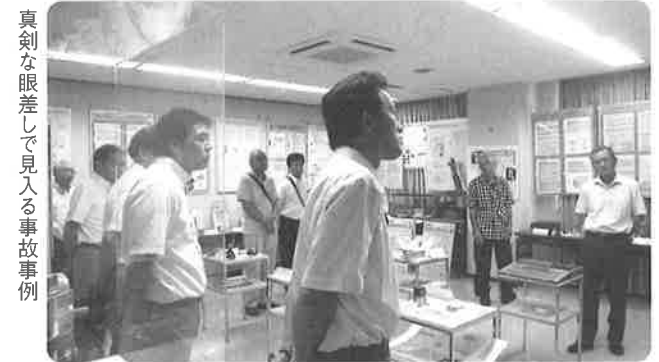
真剣な眼差しで見入る事故事例

実習棟には、一基の発電所としての機器が設置され稼働する運転状態の中での機器の運転停止故障発見 を想定し、防具を着けての現場確認など、一時たりとも注意怠慢は許されない、安全安心に掛ける厳しい姿勢の現場体験をさせていただきました。私たちは実習棟の見学を終え、原子炉・核燃料・制御棒など聞きなれない言葉の連続が、この原子力研修センターで真剣に技術の習得に取り組む実習生の姿、指導に携わら