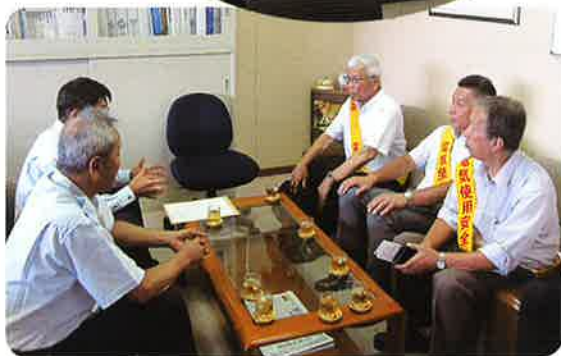
京都府府民生活部災害対策課を訪問