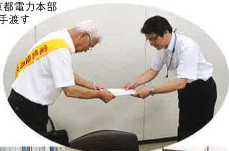
関西電力(株) 京都電力本部にて趣意書を手渡す