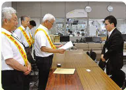
関西電力(株) 伏見配電営業所にて趣意書を手渡す