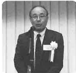
久世支部長の挨拶

続いて、総会開催に当たり久世支部長からご出席いただいた方々への御礼のお言葉があり、この1年を総括する主旨でのご挨拶があり、その後ご来賓3名の方々からご挨拶を頂戴いたしました。