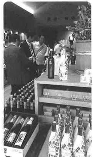
白鹿さんの記念館の売店にて買い物

京都への帰りのバスにて桂支部長より、今後の支部予定と本日の御礼の挨拶にて閉会いたしました。