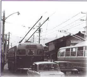
1968.12/松尾橋 西の終点 桂川畔に新設された転回場