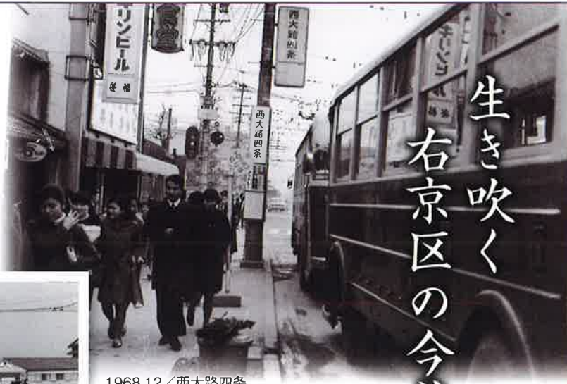
1968.12/西大路四条 ここから西は市電からトロリーバスに転換