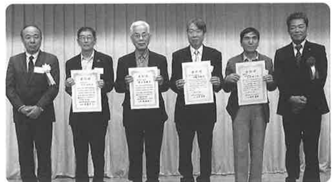
優良工事店表彰を受賞された皆さん