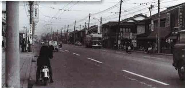
1968.12/西院巽町 バン屋、時計屋、八百屋、駄菓子屋、薬局…