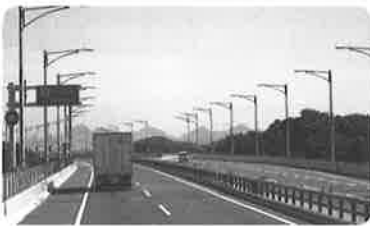
瀬戸大橋を渡り四国へ

瀬戸大橋開通30年が過ぎました。私も〇〇歳チョット老化目立つけど、「まだまだお相手