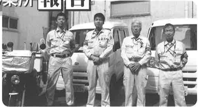
京都調査センター 南丹事業所調査員

4年目の今年度は、組織の再構築とチームワークを大切に、「ALL FOR ONE. ONE FOR ALL」「みんなは一人の為。ひとはみんなの為」の精神で事業所一丸となつて力強い知識ある組織を目指して行きます。