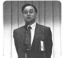
京電工組 福多副理事長様のご挨拶

らも是非理解とご協力願いたいとのご挨拶がありました。その後、京都府電気工事工業組合 福多副理事長様から、植田理事長代理としてのご挨拶があり、昨年、皆さん推薦の元、北部4支部の副理事長として就任させていただいた。以降、月の半分以上は京都に出向き多忙な生活を送っている。組合も、多くの案件を抱える状況ではあるが、組合員のために頑張っていく所存である。寒暖の変化が非常に激しい状況でもあり、季節の変わり目と言うことが無くなってきているようにも思われる。体調管理には十分気を付け体調を崩さないようにしていただきたい。とのご挨拶がありました。その後「感謝状贈呈」に移り、関西内線工事研究会 様より4名の方々に「小工事処理活動 優良工事店表彰」が授与されました。