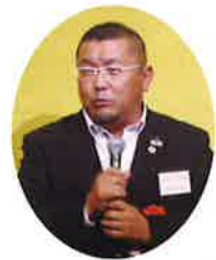
関西電気工事工業会青年部連合会大橋会長のご挨拶