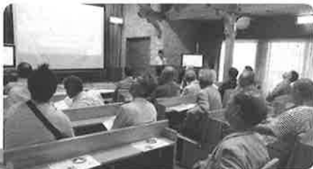
▲大河内発電所にて 総括説明