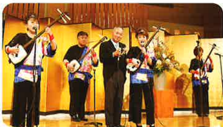
津軽三味線の演奏