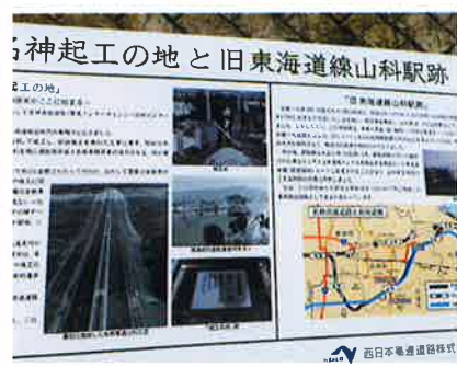
名神起工の地と旧東海道線山科駅跡の説明看板

山科は、古くから旧東海道や旧奈良街道等、交通の要所でありました。今回は、日本で最初の高速道路起工の地と旧東海道線山科駅跡を紹介します。