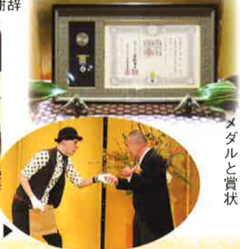
パントマイムの パフォーマンス