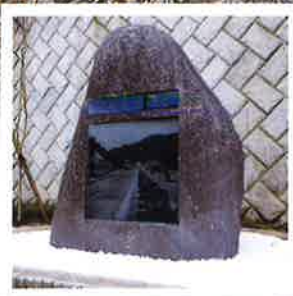
名神起工の地の石碑

巨大な名神と書かれた石標の下、名神高速道路の南側に「名神起工の地」と「旧東海道線山科駅跡」があります。