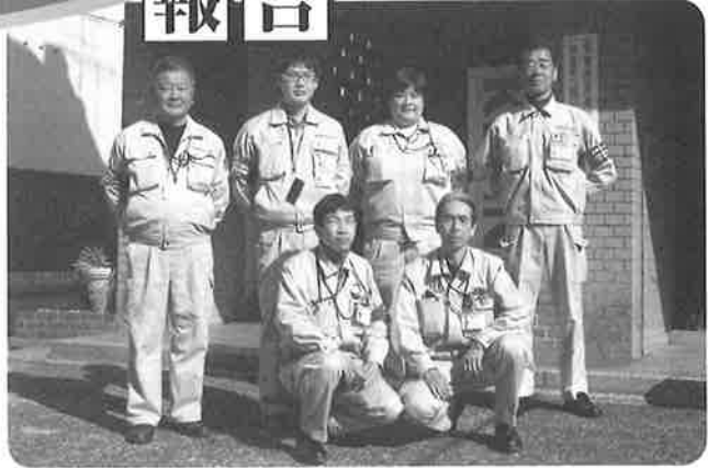
京都調査センター 定期調査2班メンバー

調査業務は技術力より、まず営業力・折衝力・説得力が求められます。毎日が飛び込み営業的な感覚の中、調査員は奮闘、努力を致しております。「こんにちは」から始まり、初対面から数秒で信頼関係を築き、見ず知らずの訪問者を家の中に招き入れていただきます。そして、屋内点検・調査を行い、安全・安心感を与え喜んでいただいて、送り出していただく作業を1日40～50件いたしております。お蔭様でようやくトラブルも少なくなり、軌道に乗りつつある今日です。