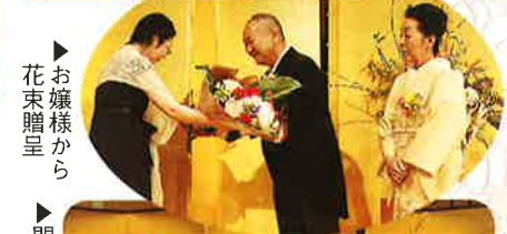
お嬢様から 花束贈呈