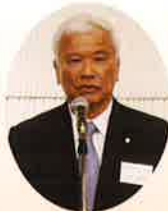
植田理事長の ご挨拶

おまかせください! 24時間365日電気保安の エキスパート! 関西電気保安協会に!