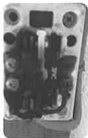
焼けたコンセント

台所の機器を使えるだけの3回路増設を勧め、配線状態を確認するために二階へ。階段下のコンセントが目についた。半分真っ黒焦げの露出Wコンセント。一階へのコードの不良で起きた状態かもと伝えるが、返事は返ってこなかった。次週に資材を手配し、お客様の都合に合わせて週末には盤の取替と回路コンセント増設工事は終わり、二階からのコード撤収で異変を発見!ご主人の和室で使用する暖房オイルヒーターを既設コンセントに差し替えるためタップを握ったら「熱い」、黒くなっている。あと数時間で「火が出た」かもしれない状態でした。危機一発とはこのことかと驚きました。“未然に防げた!”ご主人には、「危なかった。」とは伝えただけ、危機一発だとは言えませんでした…。