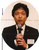
二之湯府議の ご挨拶