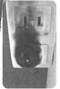
▶危機一発だった熱で焼けたコンセント

早速適正配線に着工の最終日。コード配線の撤収時、延長コードの一本が隣の部屋の暖房機に接続、熱い！タップの裏は既に変色しているが畳はまだ大丈夫！一大事、危機一発を目撃しました。安心・安全を届けることの大切さを心に強く感じた一瞬でした。