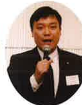
平山市議の ご挨拶

は二之湯府議、平山市議、中央会関連団体の京都府管工事工業協同組合青年会、そしてパナソニック様をはじめ