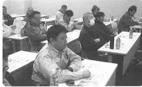
熱心に聴かれる参加者の皆さん

約2年前、国の施策である電力小売り全面自由化がスタート、国内は新たな時代へと大きく転換した。この間支部事務局では、“街の電気ドクター”として日々活躍されている組合員の心中には色々な疑問や“もやもや”が溢れ出していることを窺い、その解消策として「疑問解消型の研修会」を立案、これをもって関係する関西電力㈱様と協議を重ねられた結果、一極集中型で行うのではな