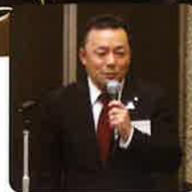
山添部長 開会の挨拶