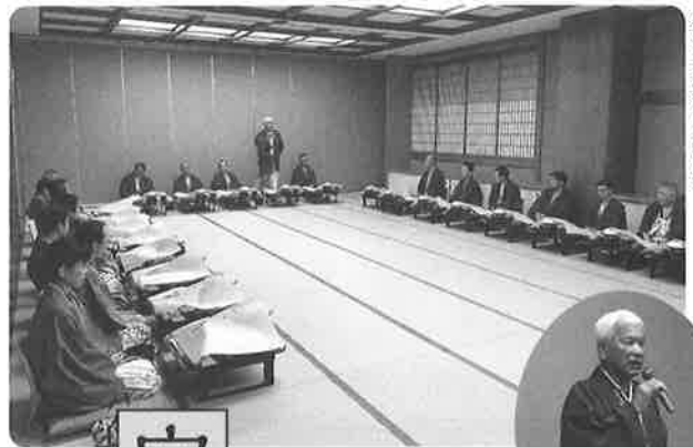
新年懇親会の様子