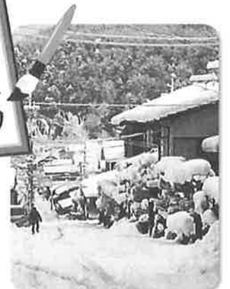
立春過ぎた大雪に春の足音聞こえません。