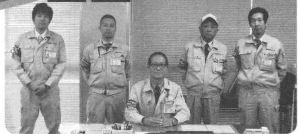
京都調査センター 竣工調査班メンバー

との適正な需給契約の締結がなされているかを調査、確認するのが竣工調査班の主な業務です。