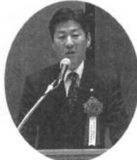
関西電力(株)萬田部長よりご祝辞