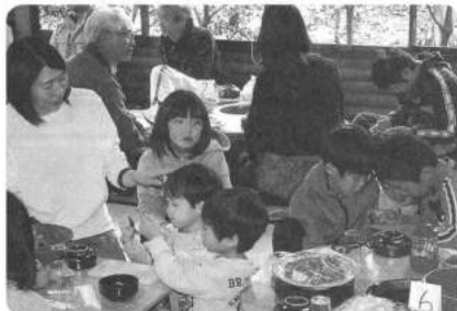
毎年気になる参加ファミリーの子供達の成長。みんな笑顔満開、和気あいあい!