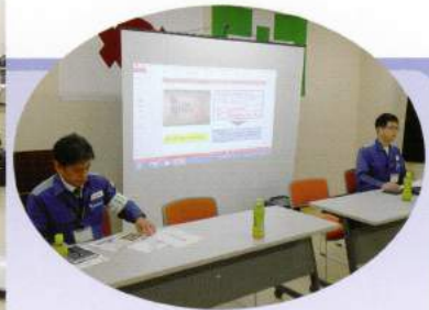
講師の関西電力職員様