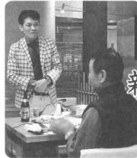
尾形副地区長締めめの言葉

伏見地区新年懇親会を去る1月20日(土)午後7時より、がんこ京都駅ビル店で開催し22名の方が出席されました。