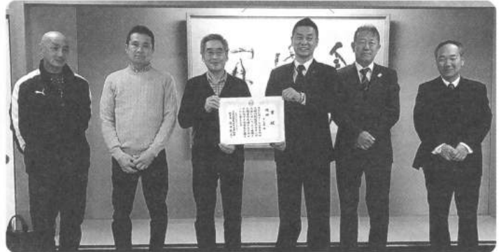
▲忘年会にてボウリング大会3連覇報告