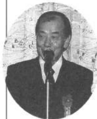
尾関議員より祝辞