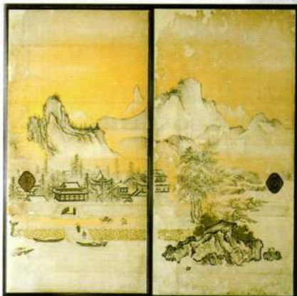
障壁画は款印がありませんが、作風等から狩野山楽一派の筆と推定されています。

方丈の東に広がる比叡山を借景とする庭園は、白砂が敷きつめられた平庭で刈り込まれたサツキが南から七・五・三と並び「獅子の児渡し庭園」ともいわれる枯山水の庭園です。