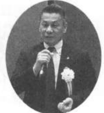
鎌谷副理事長の閉会の挨拶