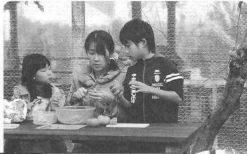
採れたての柿はやっぱりおいしい!