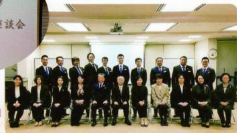
座談会参加の皆さん▶

の大騒ぎ(笑)。私自身も、いつもと違う環境に最初戸惑いを覚えました。3分もすれば…。