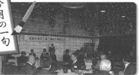
舞鶴グランドホテル展望広間 舞鶴支部新年賀詞交歓会が「夜空の星」に包まれて親睦の宴が挙行されました。

グランドの 夜空に映る 支部の顔 心重なる 賀詞交歓会 初夢に 幼き友の 戯れは 届かぬ年賀に 心痛める 平成三十年一月 なおひさ