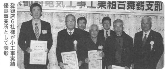
登録店6社様が小工事実績優良事業所として表彰