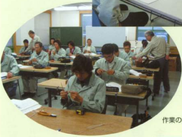
作業の実感を指先に感じます