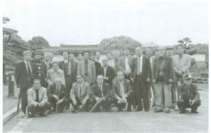
昼食会場の大阪城城内にて

昼食後、大阪歴史博物館・NHK大阪BKスタジオ（ハイビジョン放送設備）見学を済まし、予定通り、無事5時に帰着しました。関電担当者の方、松下電工様の担当の方には大変お世話になりました。