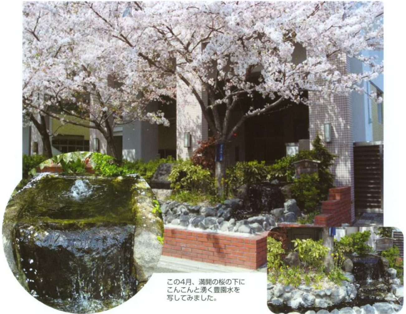
この4月、満開の桜の下に こんこんと湧く豊園水を 写してみました。