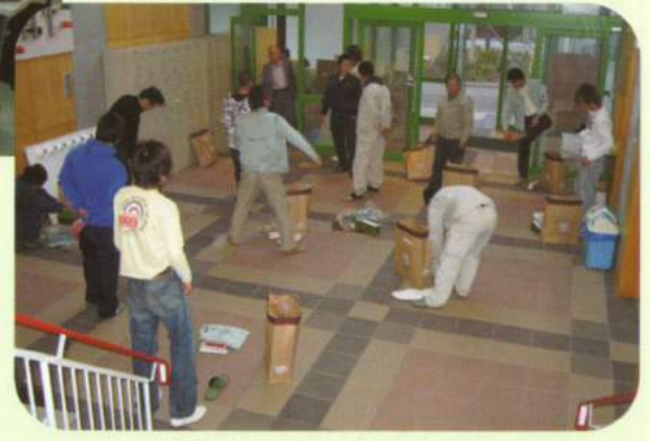
制服や教材を手に入学的実感が...