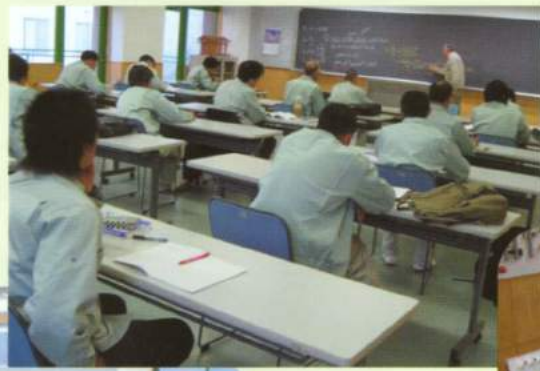
電気への知識欲が湧きます