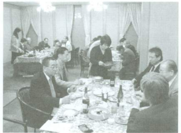
懇親会は大いに盛り上がりました

第1・2号議案、平成19年度事業報告及び収支決算報告は、百々監査役の監査結果報告を受けた上に、満場一致で快く承認されました。続く第3・4号議案平成20年度事業計画案と収支予算案では、多少の意見も出されましたが、今期の年間事業計画に重大な変更があるものとも思えないことから、結果的に予算案共々満場一致で承認可決されました。 次にその他で前記の議案以外にご意見を求めたところ、未だ地区規約がないことに関連する意見が出されました。この件は前回の通常総会においても提