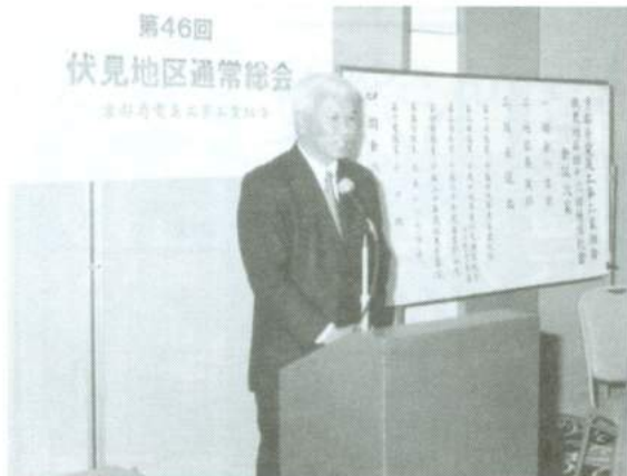
植田地区長 1周年あいさつ