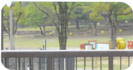
日中はチビッコ達が駆け回っています