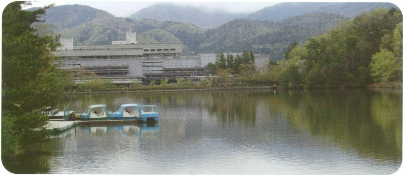
宝が池から国立京都国際会館を望む