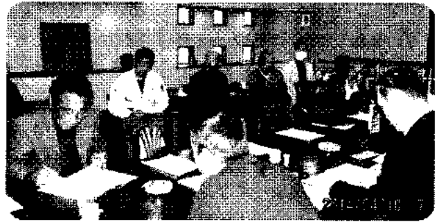
議案書に基づき、審議が行われました

平成26年4月18日（金）伏見支部、山科地区に於いては平成25年度の通常総会を開き、議案書に従って総会が山科区勤修寺地区にある料理屋「あうん」に於いて行われました。