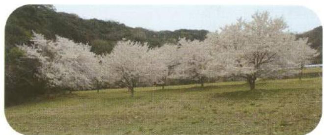
ちょうど桜が満開でした