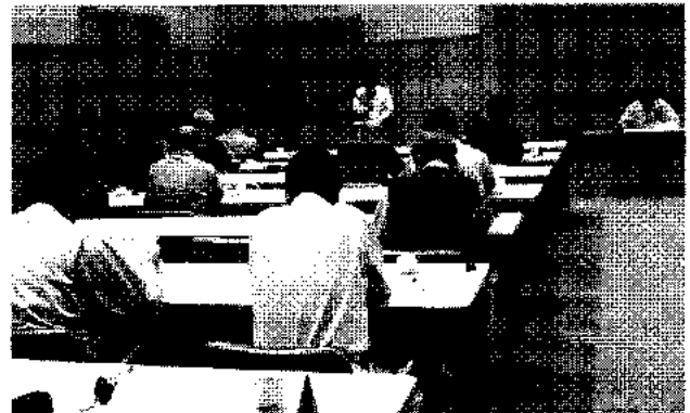
舞鶴商工観光センターにて開催

しかしながら、出席者の減少が続く昨今、手放して可決承認されたと喜んではいられないのではないのでしょうか。組合活動の大事な議案書も見ずに誰に何を委任された委任状でしょうか。自分達の事業の為に所属する組合なら、事業発展につながる組合にするために、今一度、各自が組合活動に取り組む姿勢が問われる時ではないのでしょうか。毎月の会費が無駄にならない為にも人任せにせず、各自が協力参画し組合発展、事業発展につながる事を願い、本総会に出席した所感を交え、平成25年度舞鶴支部通常総会の審議報告といたします。