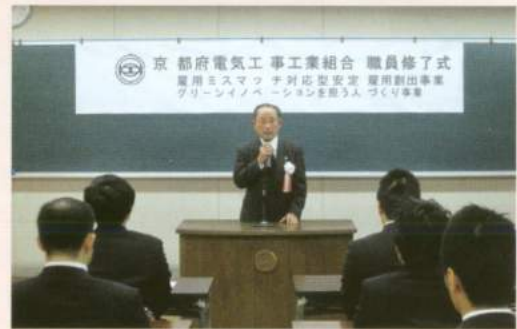
松井理事長より式辞