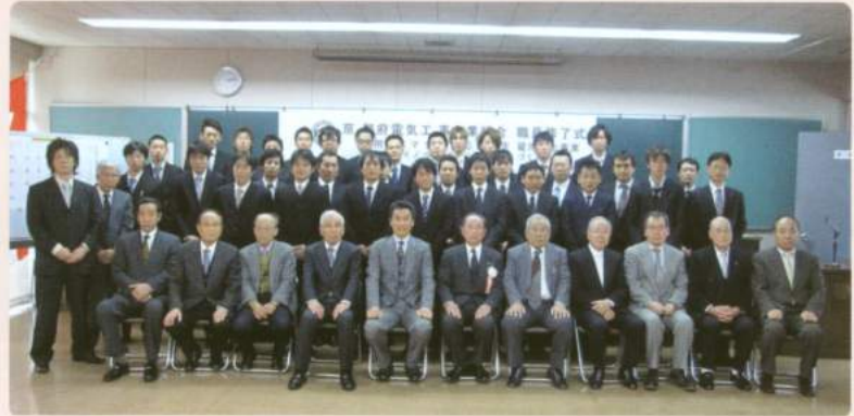
30名全員 無事修了しました

2月26日の午後1時30分より、雇用ミスマッチ対応型安定雇用創出事業、グリーンイノベーションを担う人づくり事業の職員修了式が、京都府、京都市、関西電力(株)、中央会、職業能力開発協会、パナソニック(株)様よりのご来賓を始め、安定雇用創出事業委員、京電工組理事並びに学院講師各位のご臨席を得て、厳粛に挙行されました。