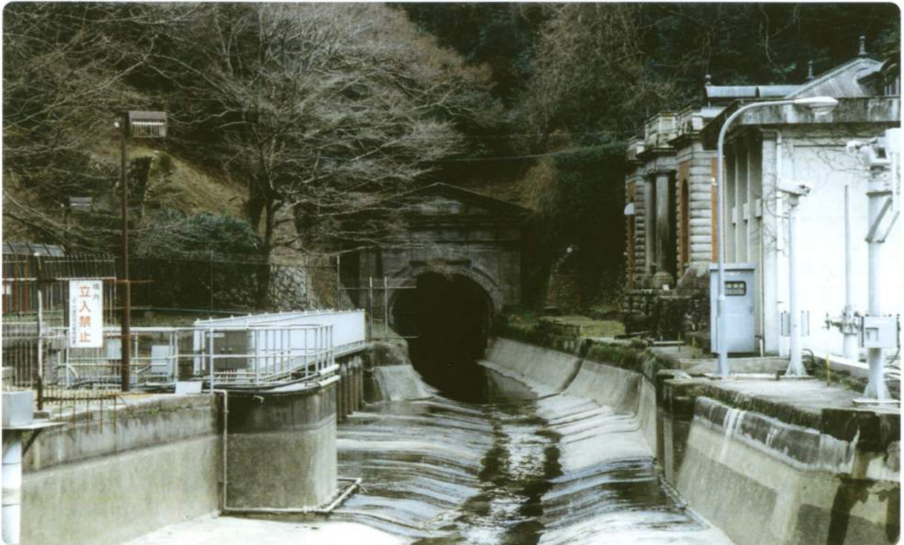
右手の赤煉瓦は、片山東熊〔京都国立博物館の設計者〕設計のポンプ室