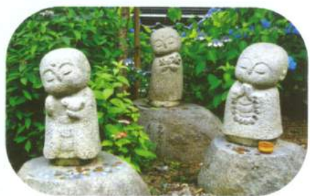
わらべ地藏様がお迎え