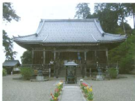
京都府指定文化財の本堂