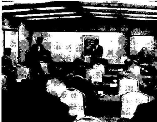
右京地区総会会場

4月19日(金)嵐山の渡月亭で今年も開催した。毎年、同じ場所で開催しているのには訳がある。役員会を開催する控室、総会を開催する部屋を準備してくれる。そういう心配りにいつも感謝しているからである。