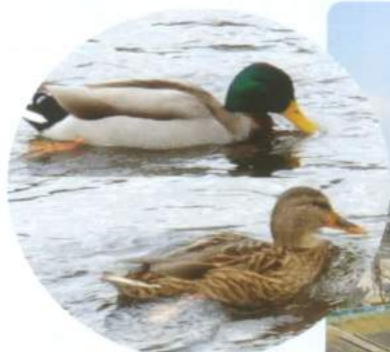
▲冬にはオシドリの姿も