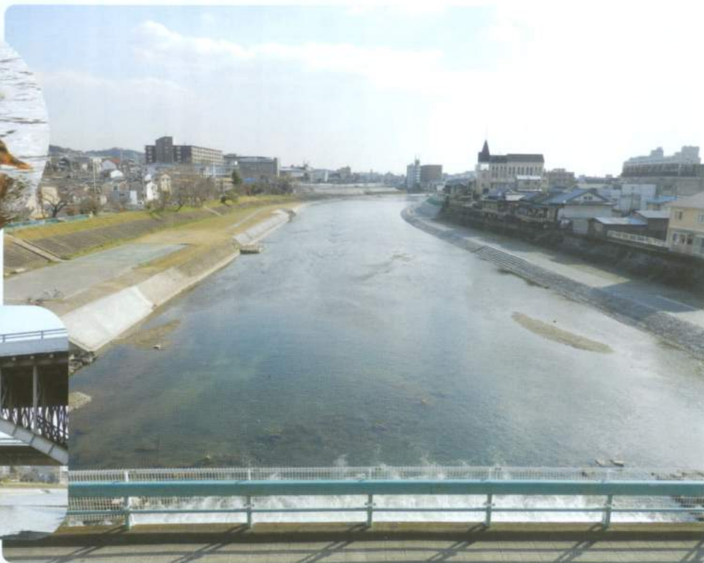
跨線橋から東山橋を臨んで。鴨川が右に蛇行する辺りが釜ヶ淵。