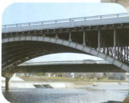
▲跨線橋(上)と並んで 小さな東山橋(下)が。