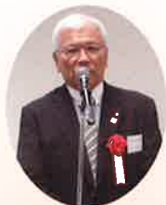
植田理事長による 青年部への 期待を込めたご挨拶