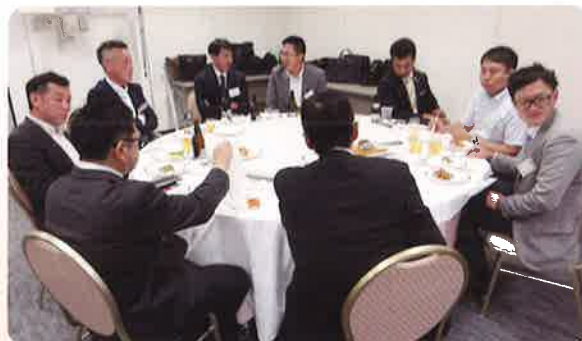
各支部会員も会話に華を咲かせていました。