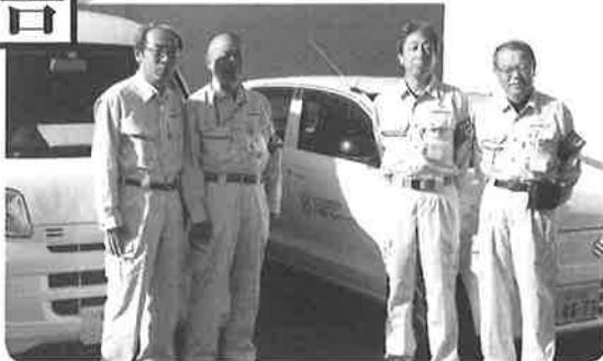
小浜調査センター調査員

今年度も、現在でも当センターの知名度が地域に行き渡っていない状況から、昨年に引続き各地区の区長様等へ調査の実施を事前にお知らせすることで、1 年間を通じ大きな問題やトラブルを発生させることなく終えられるように努めて参ります。また、今後も地域の皆様より更なるご信任をいただくために、安心・安全な調査態勢も推し進めて参ります。