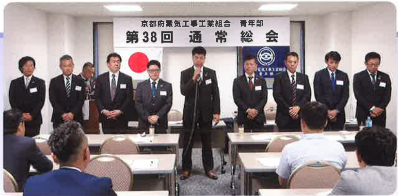
京都府電気工事工業組合 青年部 第38回 通常総会