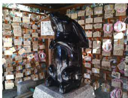
▲「狛うさぎ」が鎮座する本殿

▶「子授けうさぎ」の像 黒御影石の像に水をかけ、お腹をさすりながら祈願すると、子宝に恵まれ、安産になると信仰されています。