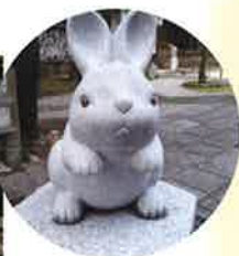
境内のいたるところに「うさぎ」がいます。