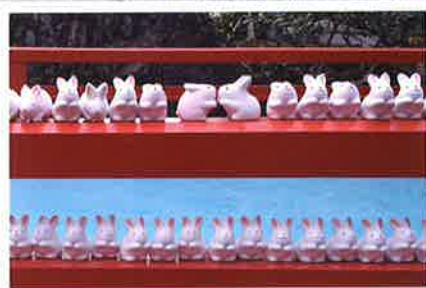
本殿前には、たくさんの「うさぎみくじ」が奉納され、参拝者の幸福を静かに見守ってくれています。

▶「子授けうさぎ」の像 黒御影石の像に水をかけ、お腹をさすりながら祈願すると、子宝に恵まれ、安産になると信仰されています。