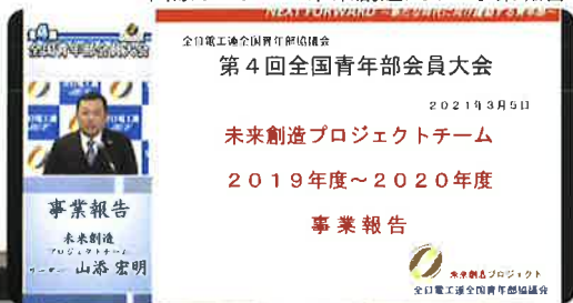
大会当日のリハーサルの様子