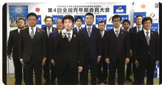
木多副会長の閉会挨拶